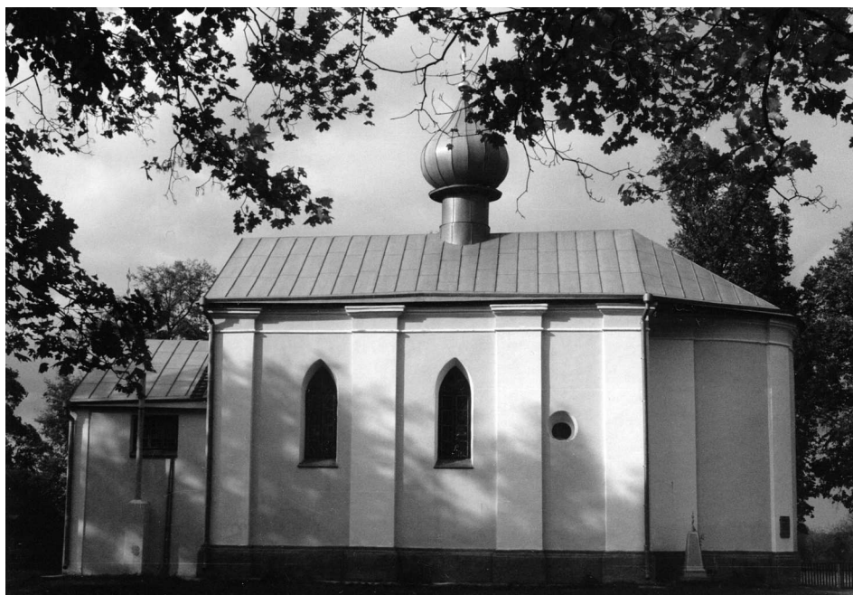
Ryc. 3. Widok cerkwi od strony południowej