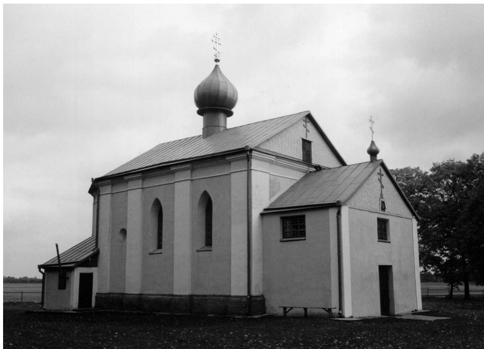
Ryc. 2. Widok cerkwi od strony północno-wschodniej