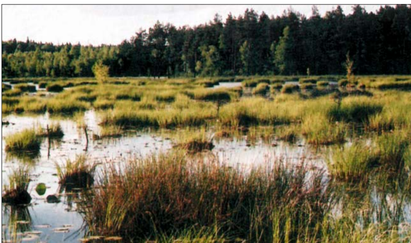
Ryc. 5. Rezerwat Moczydło w Nadbużańskim Parku Krajobrazowym The Moczydło Reserve in the Nadbużański Landscape Park