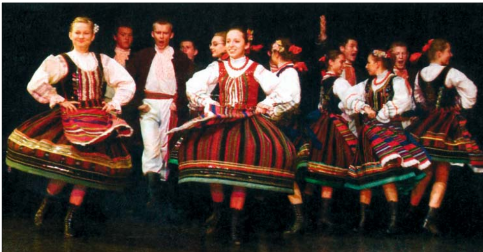
Ryc. 7. Zespół Pieśni i Tańca Ziemi Siedleckiej „Chodowiacy” The Song and Dance Group of the Siedlce Land “Chodowiacy”