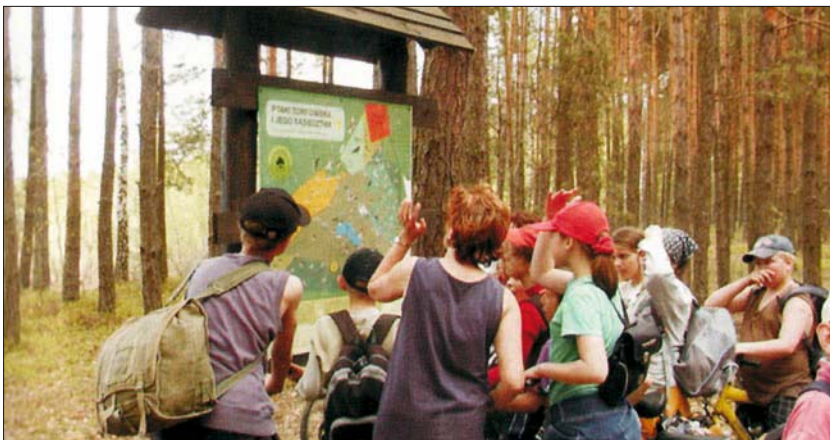
Ryc. 4. Ścieżka przyrodnicza „Kules” w Nadbużańskim Parku Krajobrazowym The "Kules" natural track in the Nadbużański Landscape Park