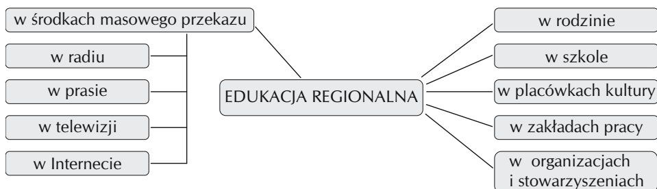
Ryc. 2. Model systemu edukacji regionalnej The model of regional educational system

Szeroką działalność w zakresie edukacji regionalnej prowadzi Muzeum Henryka Sienkiewicza w Woli Okrzejskiej, wsi położonej na Wysoczyźnie Żelechowskiej, 30 km na południowy zachód od Łukowa. Zbiory Muzeum mieszczą w kilku salach wystawowych: tradycje rodzinne i związki wybitnego pisarza z ziemią łukowską, życie i twórczość noblisty, jego działalność społeczną i patriotyczną, rzeźby ludowe przedstawiające bohaterów jego utworów oraz meble i przedmioty związane z pisarzem. Muzeum prowadzi rozległą działalność upowszechniającą twórczość laureata literackiej Nagrody Nobla. Omawiana placówka muzealna przywiązuje szczególną wagę do współpracy szkół noszących imię Henryka Sienkiewicza. W Okrzei położonej 5 km na południowy zachód znajduje się kopiec usypany w latach 1932–1938 ku czci wielkiego pisarza (Łęcki 2005) (Ryc. 3).