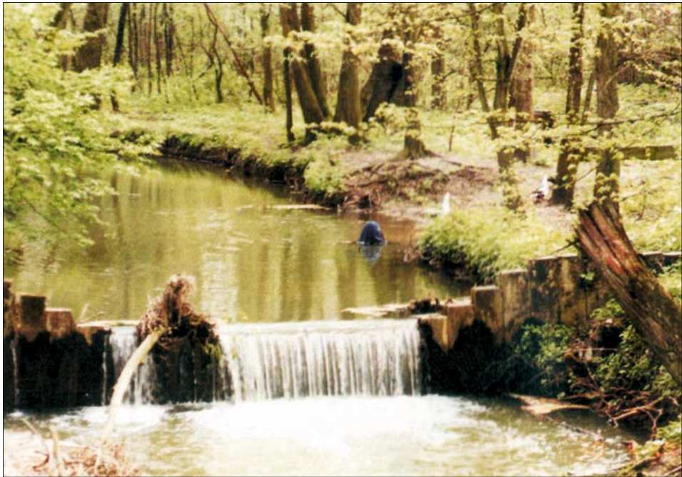
Ryc. 6. Rzeka Kołodziejka w Rezerwacie Przekop The Kołodziejka river in the Przekop Reserve