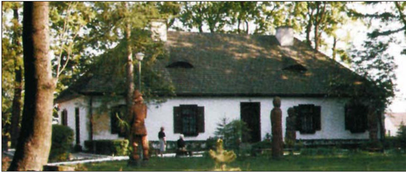
Ryc. 3. Muzeum Henryka Sienkiewicza w Woli Okrzejskiej – miejsce urodzenia pisarza The Museum of Henryk Sienkiewicz in Wola Okrzejska – the writer's place of birth