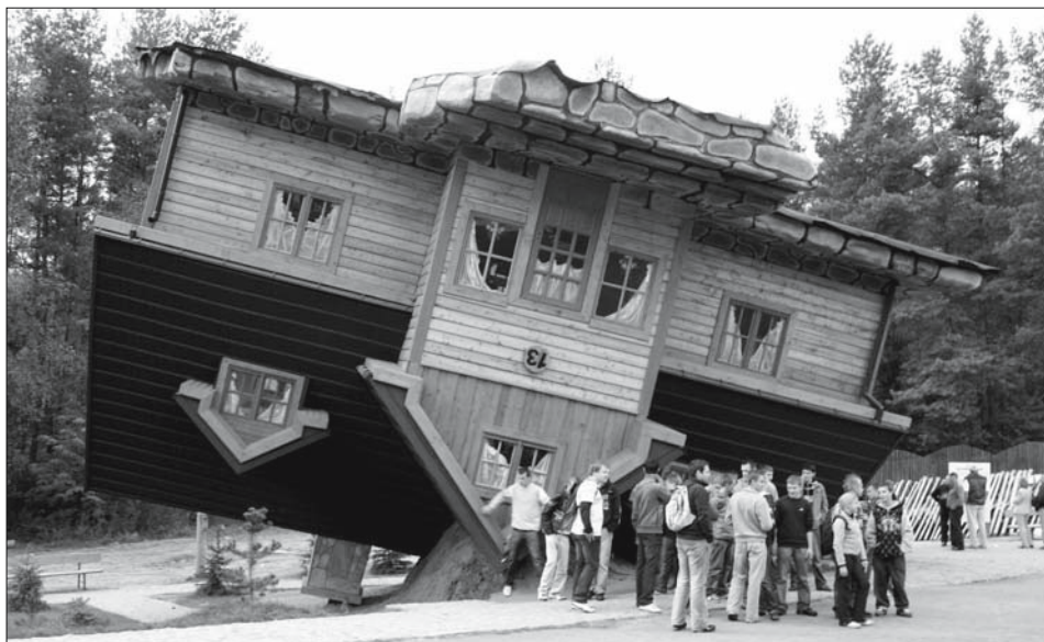
Ryc. 3. Centrum Edukacji i Promocji Regionu w Szymbarku. The Education and Promotion of Region Centre in Szymbark.

Przytoczone dane należy traktować jednak bardzo ostrożnie, gdyż są oparte na jednostkowym badaniu ankietowym. Dopiero prowadzenie tego rodzaju badań przez kilka lat pozwoliłoby na jednoznaczne i w pełni wiarygodne określenie nie tylko głównych segmentów rynkowych, ale również ich szczegółowych cech.