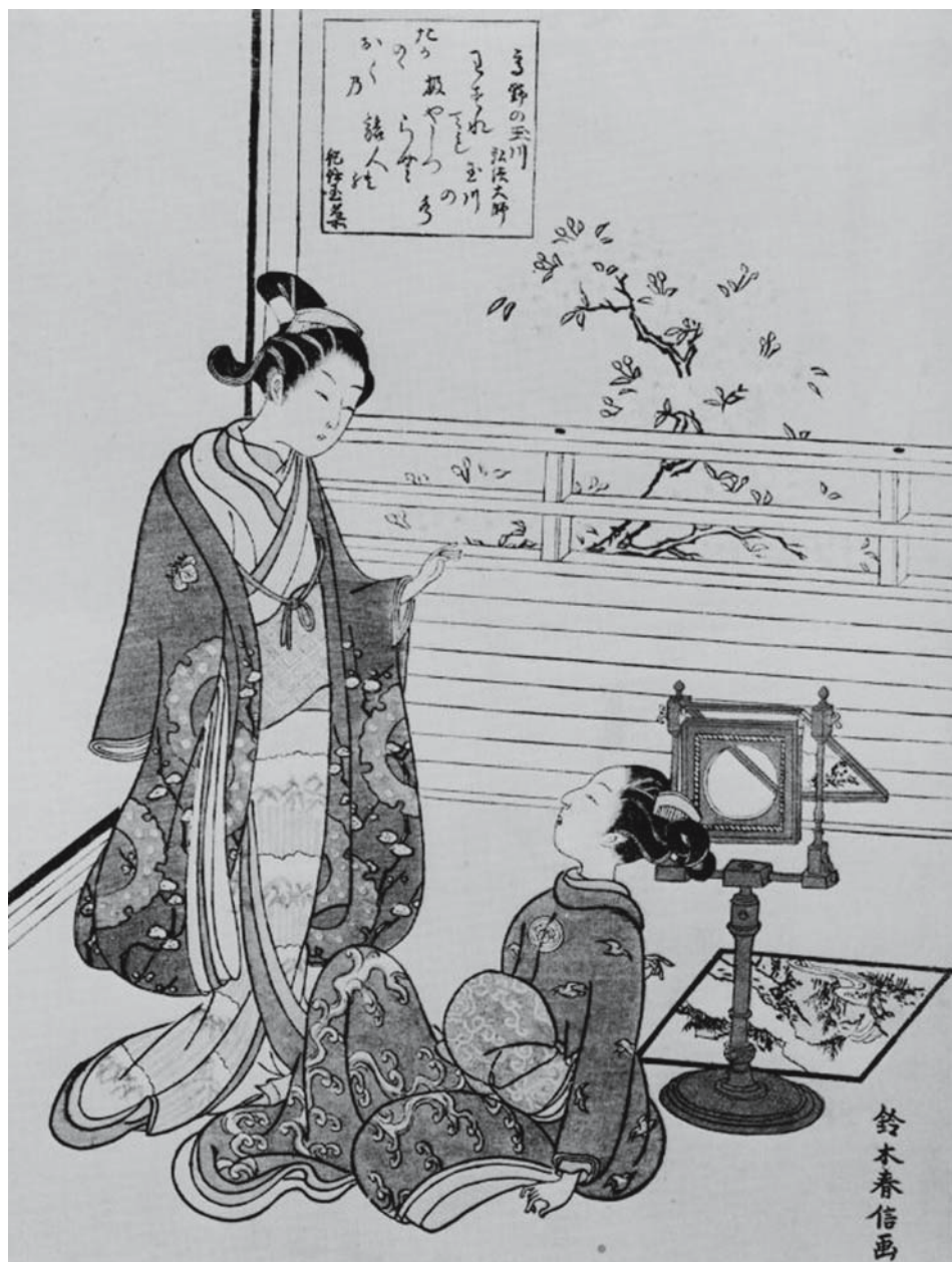
Ilustracja 11. Suzuki Harunobu (1725?-1770), Dwie piękne dziewczyny z zograscopes , drzeworyt koniec lat 1760(?).