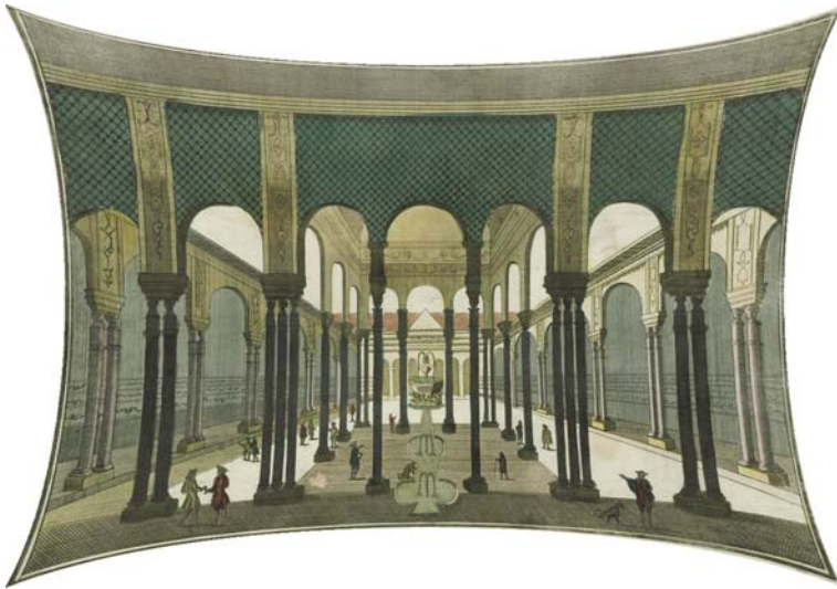
Ilustracja 6. Dziedziniec Lwów w pałacu Maurów w Grenadzie, grafika ok. 1760. Symulacja efektu zniekształcenia grafiki przez pozorne, żaglaste ugięcia jej powierzchni w optyce dwustronnie wypukłej soczewki (na podstawie reprodukcji).

W percepcji widza tworzy się wrażenie trójwymiarowego menisku wklęsłego. Centrum grafiki cofa się, krawędzie występują do przodu, naroża unoszą się pozornie ku widzowi. Daje to efekt wycinka hemisferycznej dioramy (zob. il. 6). Rezultat ten znacznie zwiększa u widza poczucie rzekomej trójwymiarowości przestrzeni 8 .