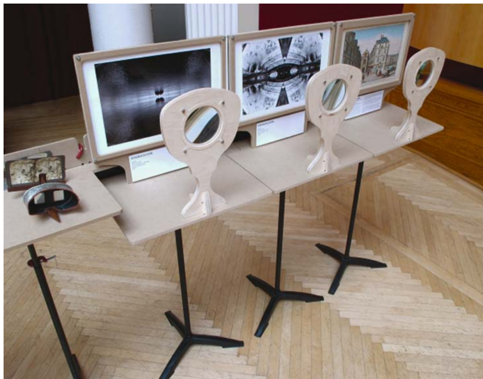
Ilustracja 12. Wystawa ART & CODE: DIY 3D Sensing and Visualization (fragment) 43 .

Ilustracja nr 12 przedstawia właśnie jedno z takich wydarzeń. To fragment wystawy towarzyszącej festiwalowi i konferencji naukowej ART & CODE: DIY 3D Sensing and Visualization , która odbyła się w dniach 21-23 listopada 2011 roku w Carnegie Mellon University w Pittsburgu, zorganizowanej przez Art & Code 3D – laboratorium badań nietypowych i interdyscyplinarnych, prowadzonych na pograniczu sztuki, nauki, kultury i technologii. Tematem jej były problemy artystyczne, techniczne, taktyczne i kulturowe, jakie niosą ze