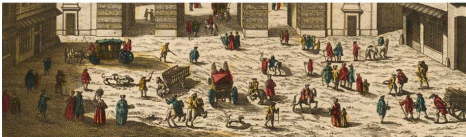
Ilustracja 10. Widok Paryża, brama Saint Martin, vue d'optique 31x45 cm, ok. 1760.

Kolejny efekt pozorowania przestrzenności grafiki przez zograscope związany jest z powszechną praktyką podkolorowywania vue d'optique , co nie jest zabiegiem czysto ornamentalnym. Powstaje dzięki temu efekt chromostereopsis – wrażenie głębi przestrzennej osiągnięte w dwuwymiarowych obrazach, na skutek zestawiania ze sobą kolorów odległych na skali „temperaturowej” barw 15 . Relatywne różnice temperatury barw przekładane są na wrażenie dystansu do oka obserwatora. Szczególnie aktywnie działają w tym kierunku skrajne zestawienia: czerwony – niebieski,