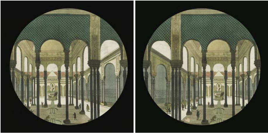
Ilustracja 7. Pole widzenia lewego oka. Ilustracja 8. Pole widzenia prawego oka.

Jednak najważniejsze zadanie soczewki zograscope nie polega na typowym wykorzystaniu jej jako szkła powiększającego. Zograscope w sposób bardzo twórczy preferuje w działaniu inną cechę obustronnie wypukłej soczewki. Wykorzystuje jej skrajne obszary, położone wzdłuż horyzontu wzroku jako dwa przeciwnie skierowane pryzmaty 12 .