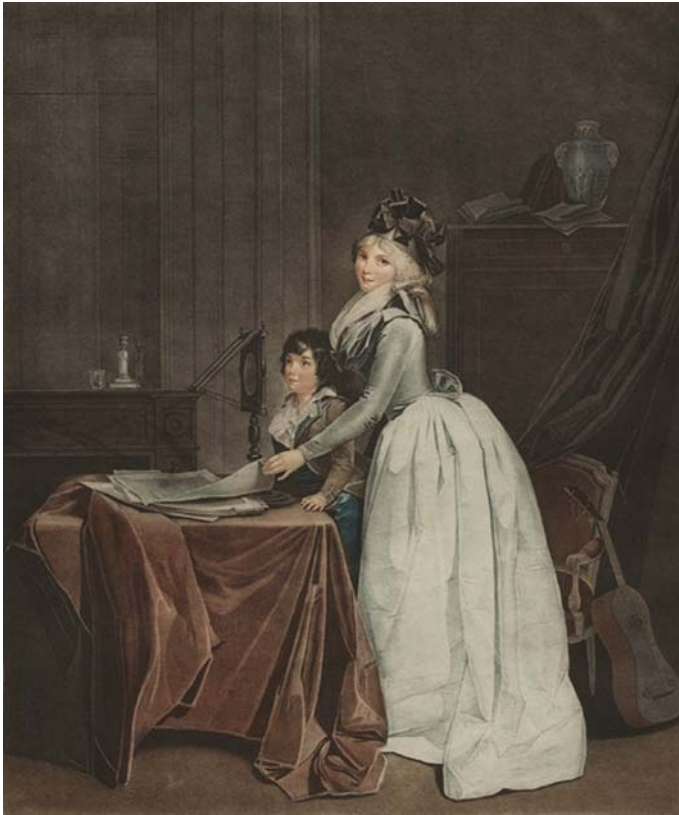
Ilustracja 3. Louis Leopold Boilly (1761-1845), L'optique .

ne zespolone są korpusem, który wynosi je ponad powierzchnię ekspozycji grafiki na około 45 cm 3 . Dzięki temu osoba siedząca przy stole patrzyła na wprost przez obiektyw na lustrzane odbicie grafiki leżącej płasko na blacie w zasięgu jej ręki, co jest najkorzystniejsze z punktu widzenia skuteczności działania optyki urządzenia i ułatwia przekładanie kolejnych obrazów (zob. il. 3).