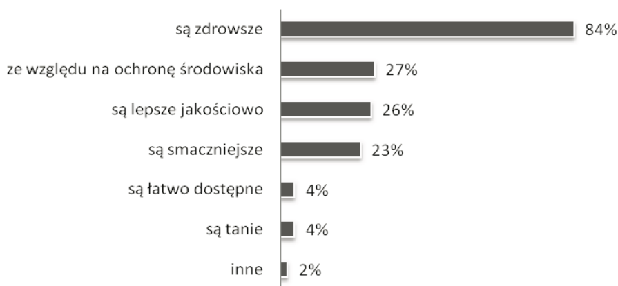
Rysunek 3. Motywy kupowania produktów ekologicznych