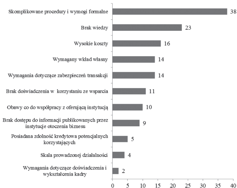
Rysunek 2. Bariery współpracy przedsiębiorstw z instytucjami otoczenia biznesu

Pomimo szerokiej oferty instytucji otoczenia biznesu respondenci dostrzegają pewne bariery w podjęciu współpracy (rysunek 2). Najważniejszym czynnikiem uniemożliwiającym uzyskanie wsparcia są skomplikowane procedury i wymogi formalne (38 wskazań). Ponadto firmy zwracały również uwagę na niewystarczającą wiedzę (23 podmioty). Tego typu ograniczenia są uciążliwe zarówno dla małych przedsiębiorstw, jak i dużych spółek dysponujących znacznymi środkami finansowymi i dostępem do porad prawnych. Jednakże dla nowo powstałych przedsiębiorstw koszty i zniechęcający charakter biurokratycznych utrudnień mogą okazać się niemożliwe do pokonania. W wielu przypadkach przedsiębiorstwa, które mają problem z uzyskaniem wsparcia od instytucji otoczenia biznesu, porzucają plany wejścia na rynek. Zniesienie tych barier może wpłynąć na wykorzystanie licznych możliwości biznesowych, związanych między innymi z wejściem na nowe rynki.