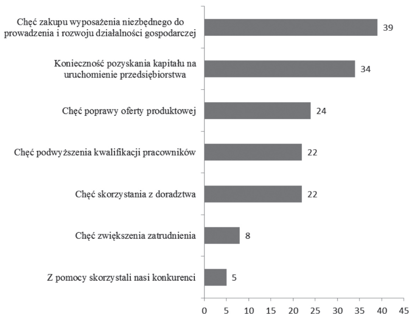
Rysunek 1. Przyczyny współpracy przedsiębiorstw z instytucjami otoczenia biznesu