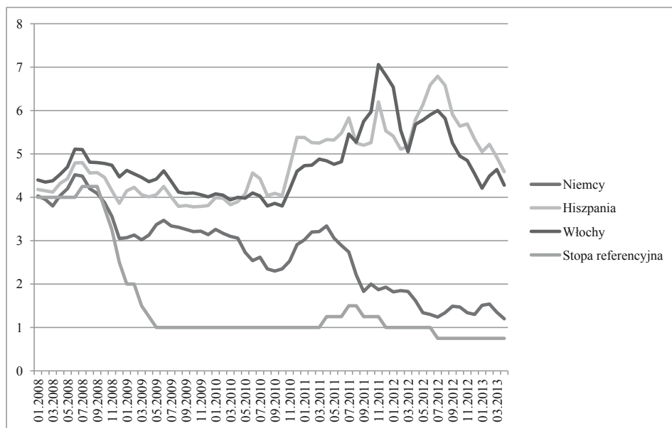
Rysunek 2. Stopy referencyjne EBC i rentowność rządowych papierów dłużnych wybranych państw strefy euro w okresie styczeń 2008–marzec 2013 roku (w %)

gospodarczej w strefie euro, stopy procentowe EBC zwiększono o 25 punktów bazowych. Do następnej takiej podwyżki doszło 13 listopada 2011 roku. 9 listopada 2011 roku rozpoczął się natomiast kolejny okres obniżek stóp procentowych. W wyniku czterech decyzji stopa referencyjna została zredukowana o 100 punktów bazowych, zaś stopa depozytowa osiągnęła poziom 0%. W ten sposób stopy procentowe w strefie euro osiągnęły historyczne minimum.