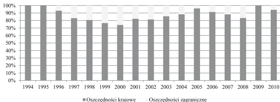
Rysunek 1. Udział procentowy w finansowaniu inwestycji krajowych oszczędności krajowych oraz oszczędności zagranicznych w Polsce w latach 1994–2010

Inwestycje krajowe w Polsce w latach 1994–2010 były w przytłaczającej wielkości finansowane oszczędnościami krajowymi. Stopień pokrycia średniorocznych inwestycji krajowych oszczędnościami krajowymi wynosił w tym okresie średniorocznie około 89%. Zmiany udziału procentowego finansowania inwestycji przez oszczędności krajowe oraz zagraniczne (różnica między inwestycjami krajowymi a oszczędnościami krajowymi) w Polsce w okresie od 1994 do 2010 roku przedstawiono na rysunku 1. Z kolei na rysunku 2 pokazano kształtowanie się inwestycji i oszczędności krajowych w relacji do PKB.