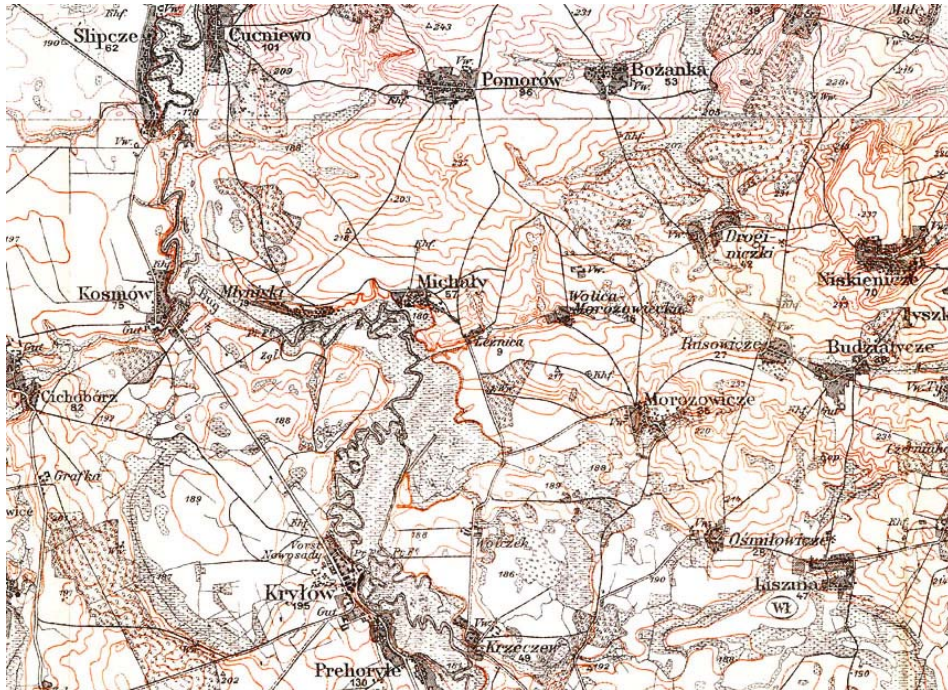
Il. 1. Michale i okolice, fragment mapy Karte des westlichen Russlands , 1915 r., 1 : 100 000, Gruppe III, 0/38, 0/39.