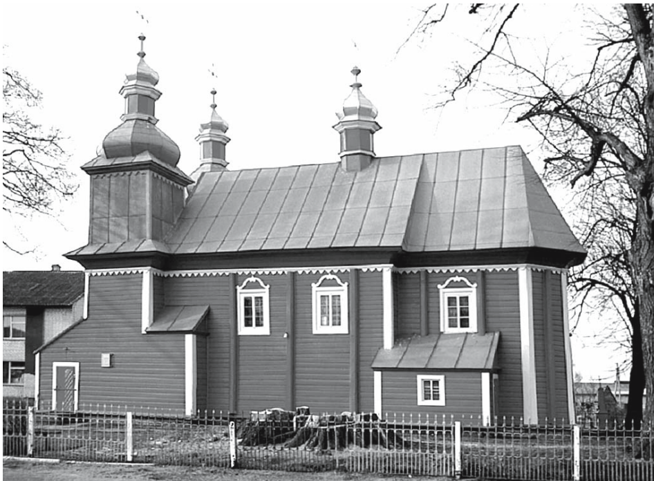
II. 5. Olble Ruskie na Wołniu (obecnie: Грудки) – unicka cerkiew dwuwieżowa z 1771 roku. Fot. G. Rąkowski 2003.