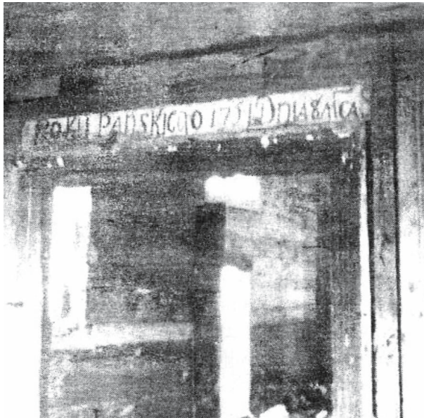
II. 4. Michale – inskrypcja na nadprożu. Repr. z: O. Хведів, На кручі Бугу (Свято-Введнська церква села Михале). Історико-краєзнавчий нарис , Луцьк 2002, s. 11.