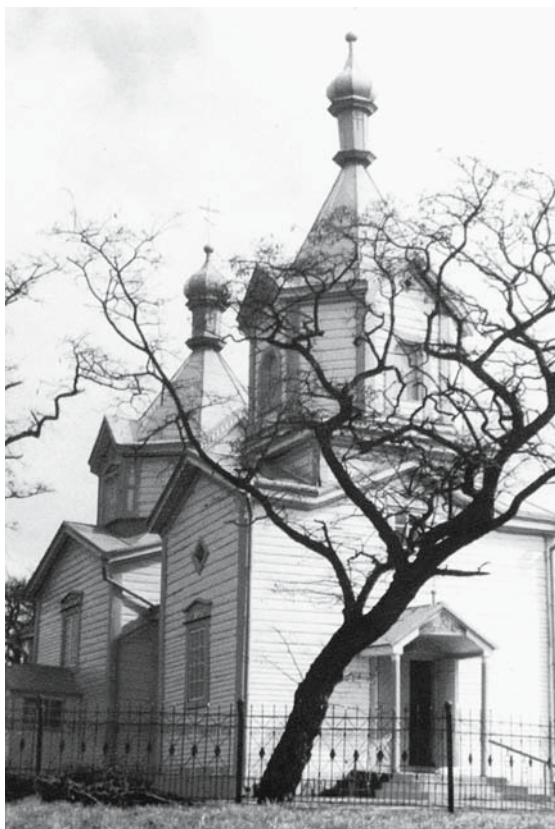
П. 2. Michale – cerkiew, fot. М. Коц. Репр. з: Л. Бабич, В. Свистун, Храми Волині , Луцьк 2004, s. 36.