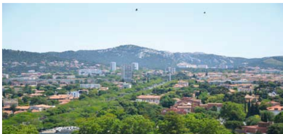
Ilustracja 7. Krajobraz roztaczający się z dachu Unite d'Habitation .