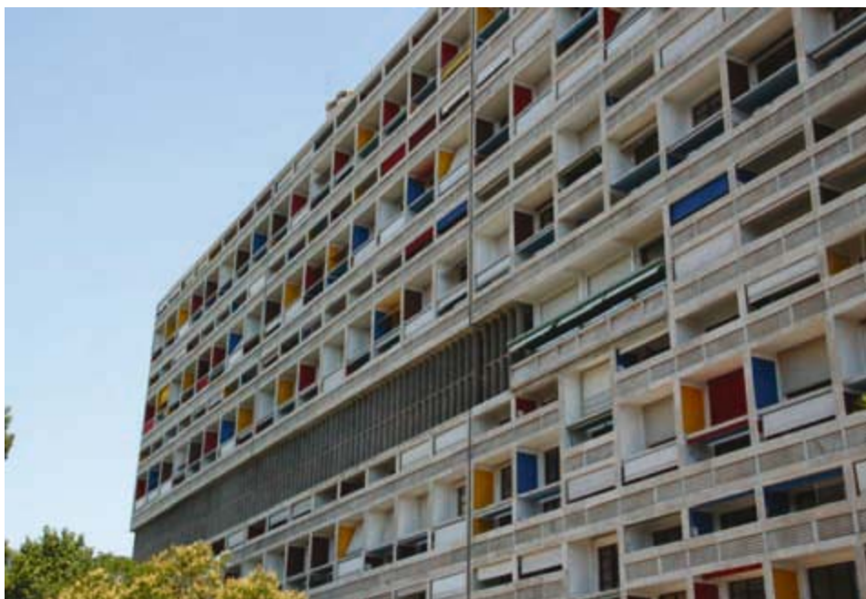
Ilustracja 3. Elewacja Jednostki Marsylskiej, Marsylia, fot. K. L. Boguszewska (2012).