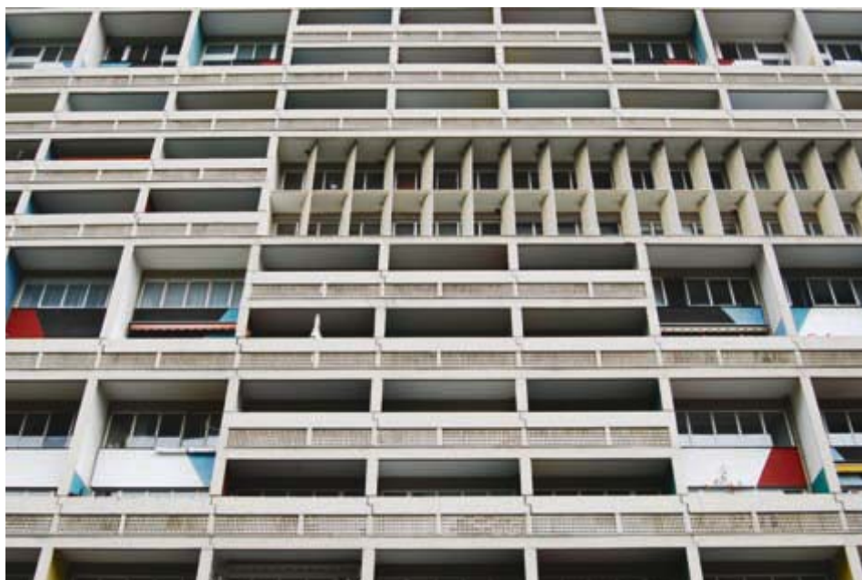
Ilustracja 11. Relief elewacji Jednostki Berlińskiej.

Jednostka Berlińska posiada podobny, jakkolwiek znacznie zubożony schemat funkcjonalny; także i tu Le Corbusier zaprojektował pasaż handlowy dla mieszkańców. Do dzisiaj w budynku jednostki funkcjonują poczta i dostępny dla turystów hotel. Budynek ten, podobnie jak wszystkie inne realizacje szwajcarskiego architekta, przyciąga rzesze zwiedzających. Rozrzeźbiona elewacja i łamacze słońca ( brise soleil ) zastosowane w Berlinie przypominają wprawdzie realizację z południa Francji, równocześnie jednak przyjęte rozwiązania wydają się nieadekwatne do poziomu i natężenia insolacji w tym rejonie Europy (il. 11, 12).