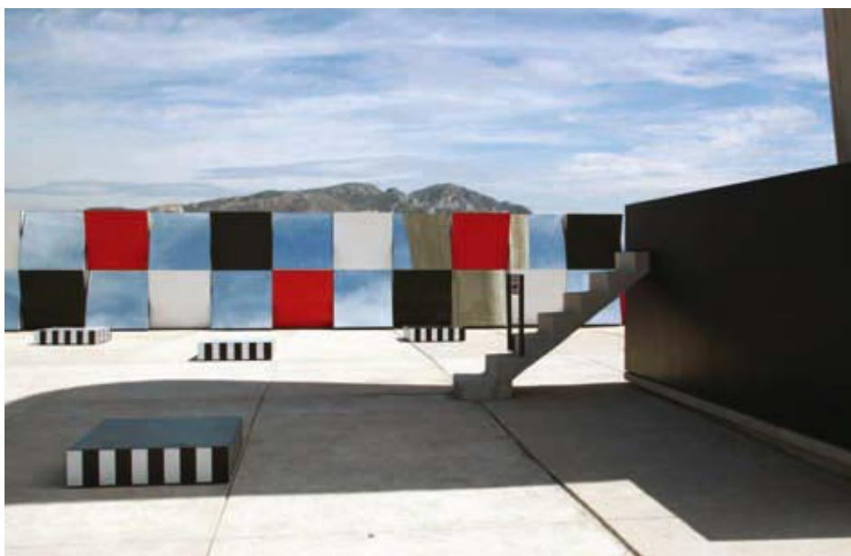
Ilustracja 9. Daniel Buren, instalacja Défini, Fini, Infini na dachu Jednostki Marsylskiej