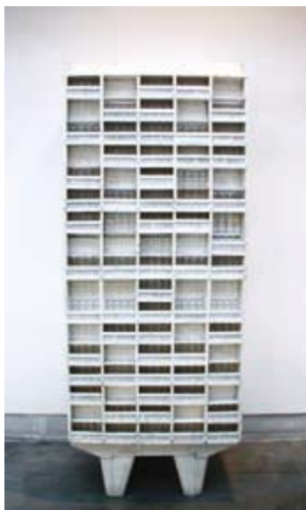
Ilustracja 2. Model Jednostki Marsylskiej na Biennale Architektury w Wenecji, wystawa w Arsenale, fot. K. L. Boguszewska (2010).