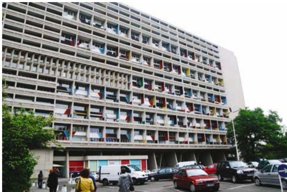
Ilustracja 10. Jednostka Berlińska, fot. A. Pilip (2010).

Budynek w Berlinie pozbawiony jest rzeźbiarskich elementów towarzyszących blokowi w Marsylii. Z kolei dach obiektu nie został przewidziany jako przestrzeń użytkowa. Architekt nie zaproponował wreszcie tak bogatego programu funkcjonalnego w postaci sal, bieżni itd., jak uczynił to w pierwowzorze. Także i sama lokalizacja berlińskiej jednostki nie jest tak spektakularna jak w przypadku bloku w Marsylii (położonego bezpośrednio nad Morzem Śródziemnym), przez co jego architektura często porównywana była do statku transatlantyckiego (zob. il. 10).