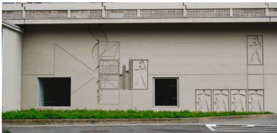
Ilustracja 12. Modulator na elewacji Jednostki Berlińskiej (2010).