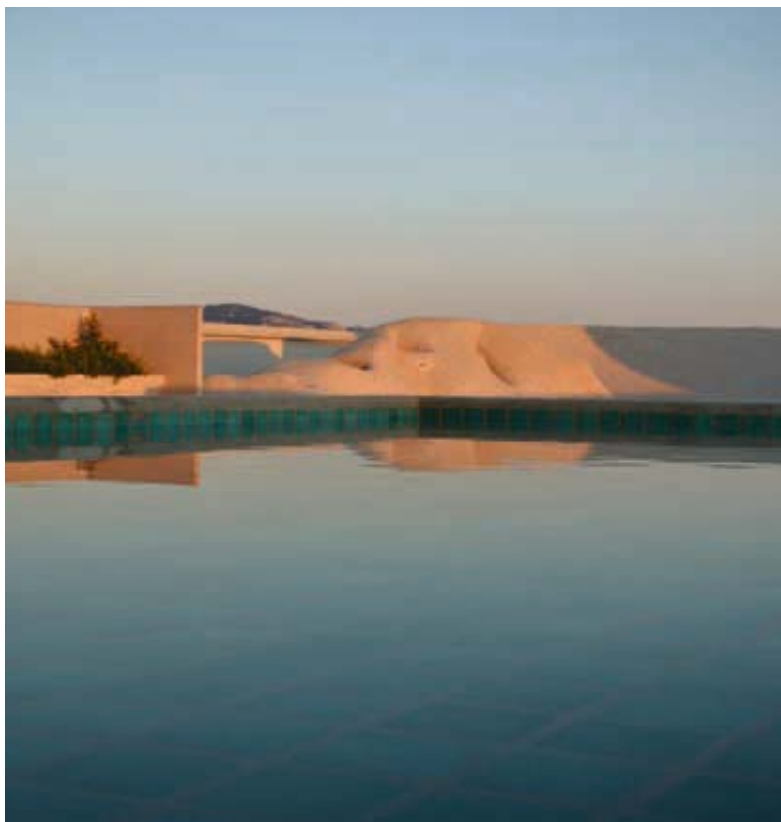
Ilustracja 6. Sztuczne góry Le Corbusiera na dachu Jednostki Marsylskiej, fot. A. Pilip (2012).