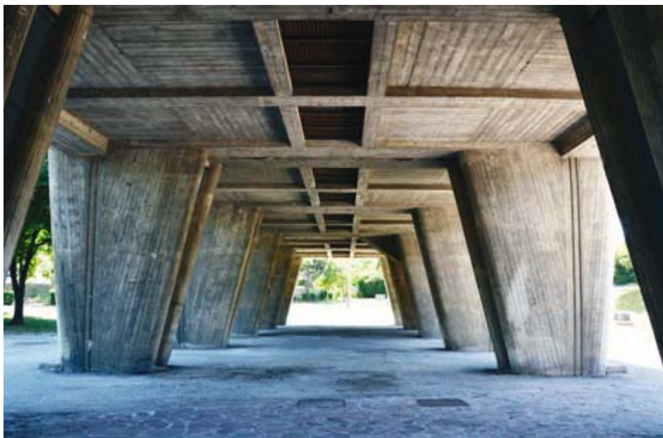
Ilustracja 5. Pilotis , Marsylia (2012).

Swobodny przepływ przestrzeni miał dotyczyć całego budynku, w tym także dachu jednostki, który zyskał nową funkcję – stał się miejscem spotkań mieszkańców. W jego program wpisano funkcję przedszkola i sali sportowej. Wzniesiono także miejsca do siedzenia w postaci solarium, mały basen i bieżnię obiegającą budynek.