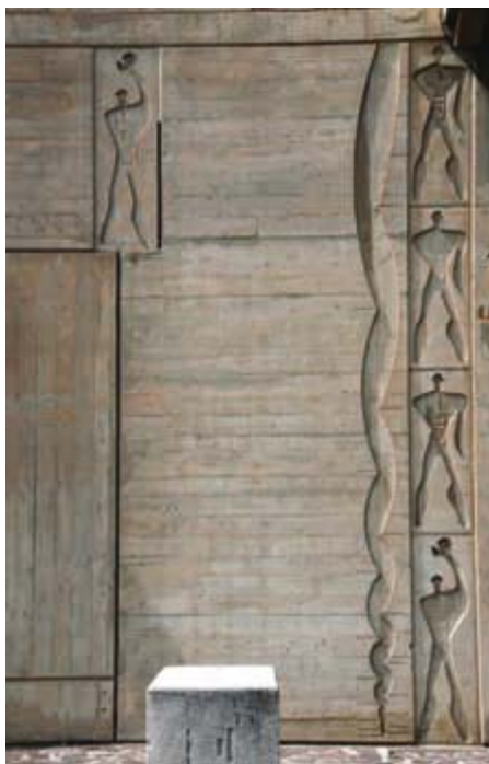
Ilustracja 4. Le Modulor na elewacji Unite d'Habitation , Marsylia, fot. K. L. Boguszewska (2014).

Budynek o wysokości 56 metrów, głębokości 24 i 137 metrów długości mieścił 337 mieszkań przeznaczonych dla 1600 osób. Jego schemat funkcjonalny oparty został na systemie dwukondygnacyjnych mieszkań o przekroju litery L 5 . Ich wysokość, a także inne parametry określone zostały przez system metryczny Modulor opracowany przez Le Corbusiera (zob. il. 4).