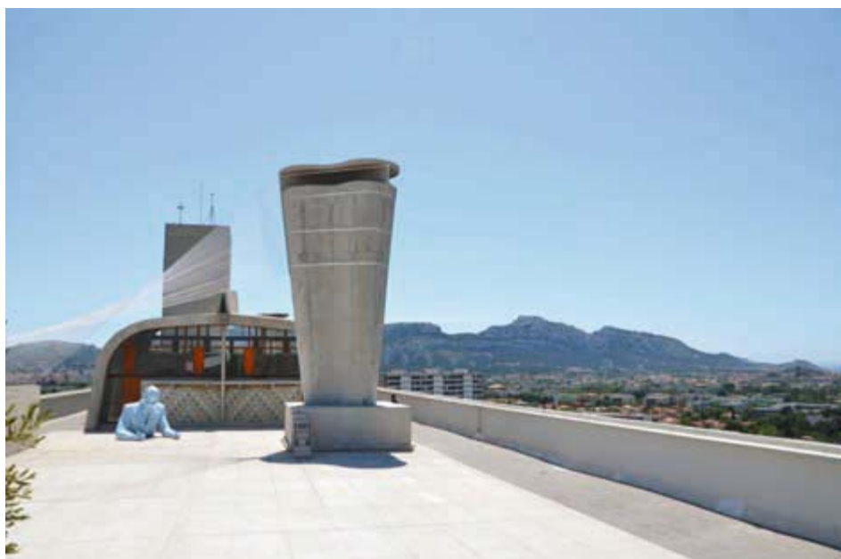
Ilustracja 8. Xavier Veilhan, instalacja Architectones na dachu Jednostki Marsylskiej, fot. K. L. Boguszewska (2013).